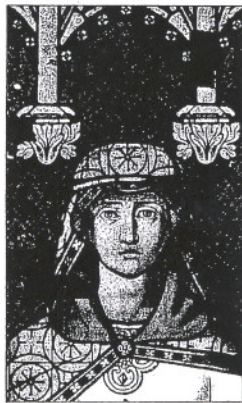
UNRESTAURIERT: Ein neugotisches Fenster.

Was etwa hat der vorgesehene Wiederaufbau des Berliner Stadtschlosses mit Denkmalpflege zu tun? Oder was die nahezu fertig gestellte neue Frauenkirche in unmittelbarer Nachbarschaft der Ausstellung? Es wird für Debatten sorgen, dass das von Heinrich Himmler zur SS-Kultstätte umgenutzte und erheblich ausgebaut mittelalterliche Schloss Wewelsberg ebenso thematisiert ist wie Funde aus dem ehemaligen Konzentrationslager Buchenwald oder das Schicksal der von einem sowjetischen Kriegsgefan-