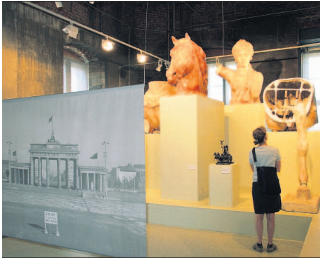
Das Brandenburger Tor ist eng mit den Tiefen und Höhen deutscher Geschichte verbunden.

200 Jahre Denkmalpflege in Deutschland zu veranschaulichen wäre bereits ein enormes Vorhaben, wenn man nur die unzweifel-